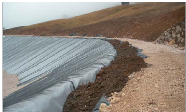
Trincea laterale interrata

Business Area: Ingegneria Ambientale Segmento: Bacini Applicazione: Bacini di innevamento artificiale Progetto: Realizzazione di un bacino di innevamento artificiale per impianti turistici Boè