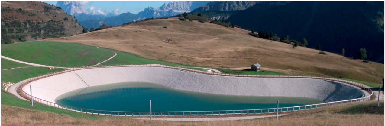
Bacino di innevamento artificiale - Vista d'insieme