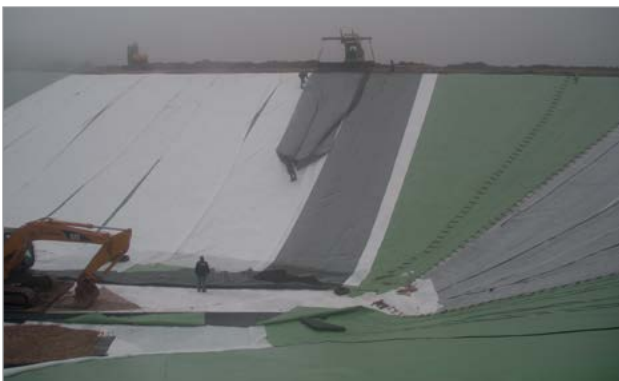
Posa del Fortrac 3D-60