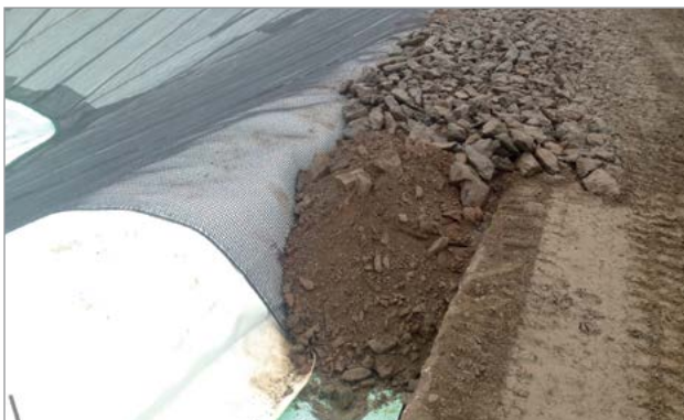
Trincea di ancoraggio geogriglia antiscivolamento Fortrac 3D