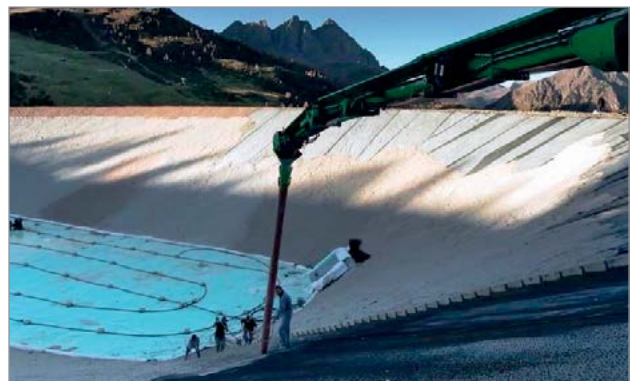
Posa ghiaia di copertura su scarpate

Business Area: Ingegneria Ambientale Segmento: Bacini Applicazione: Bacini di innevamento artificiale Progetto: Realizzazione di un bacino di accumulo per innevamento artificiale impianti Tognola, San Martino di Castrozza