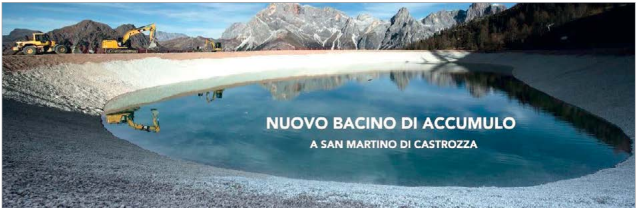
Bacino di innevamento artificiale