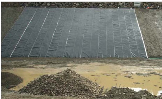
Fasi di posa primo strato Pozidrain