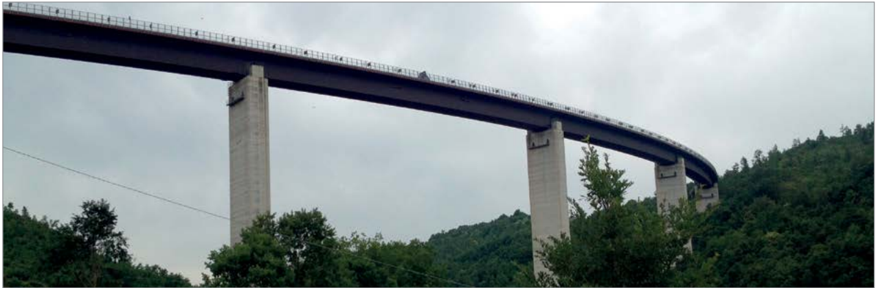
Vista generale del viadotto oggetto di intervento