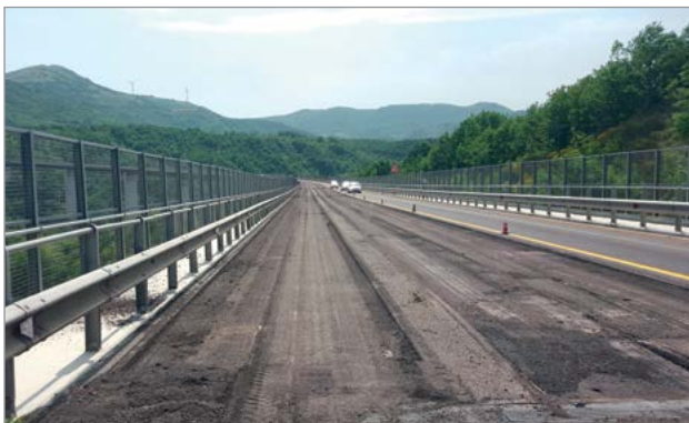
Fresatura pavimentazione esistente