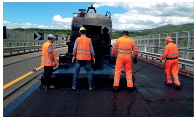
Impermeabilizzazione fase A: posa di 2,0 kg/mq di bitume modificato