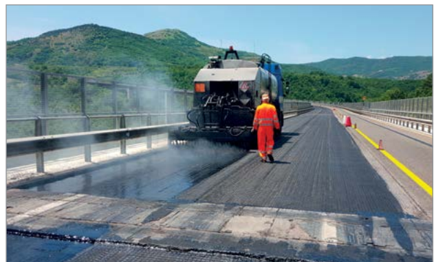
Impermeabilizzazione fase B: posa di 2,0 kg/mq di bitume modificato