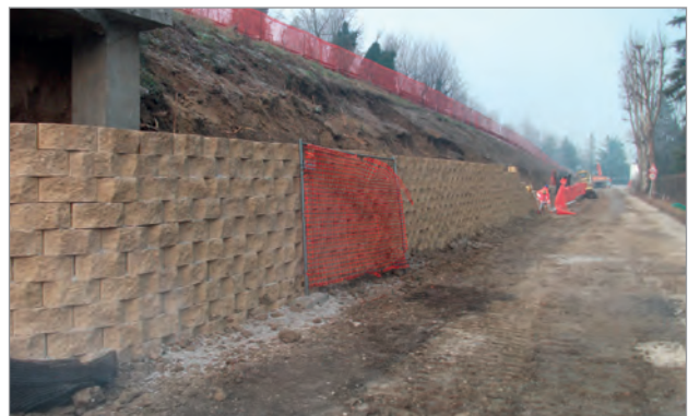
Fasi di realizzazione del muro

Business Area: Opere in Terra e Fondazioni Segmento: Terre Rinforzate Applicazione: Realizzazione pista ciclopedonale