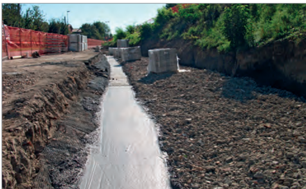
Cordolo di fondazione