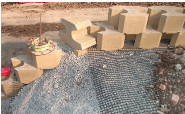
Particolare collegamento blocchi-geogriglia