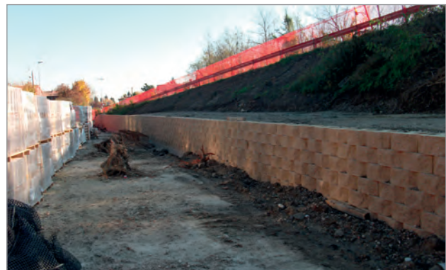
Fasi di realizzazione del muro