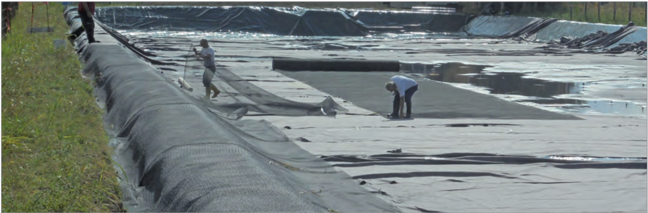
Posa Fortrac 3D®-30 sulle scarpate del bacino di raccolta acque di prima pioggia