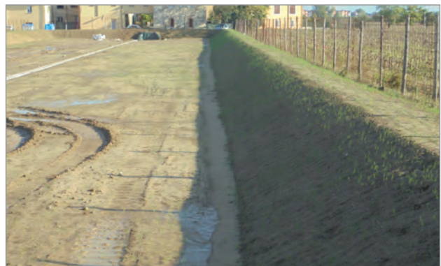
Riparto di terreno sulle sponde sopra il Fortrac 3D®

Business Area: Ingegneria Ambientale Segmento: Bacini Applicazione: Bacini di accumulo acque piovane Progetto: Realizzazione bacino da 3.850 m 2 per raccolta acque di prima pioggia