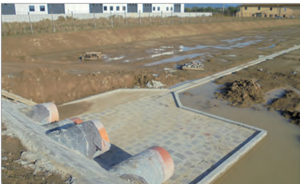
Bacino terminato e interrato